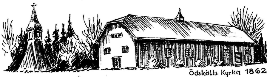
Ödskölts Kyrka 1862

"...eftersom Gud ännu klarare ville visa dem som skulle ärva det som var utlovat. Hur orubbligt hans beslut än är, bekräftade han sitt löfte med en ed. Så skulle vi genom två orubbliga uttalanden, i vilka Gud omöjligt kan ljuga, få en kraftig uppmuntran. Vi som har sökt vår tillflykt i att hålla fast vid det hopp vi äger. I detta hopp har vi ett tryggt och säkert själens ankare som når innanför förlåten. För vår skull gick Jesus dit in och öppnade vägen för oss..."