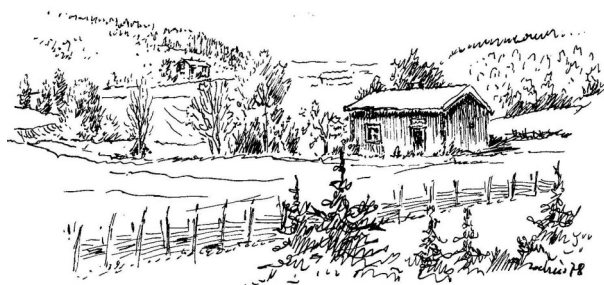
Lilldalen och Dalen